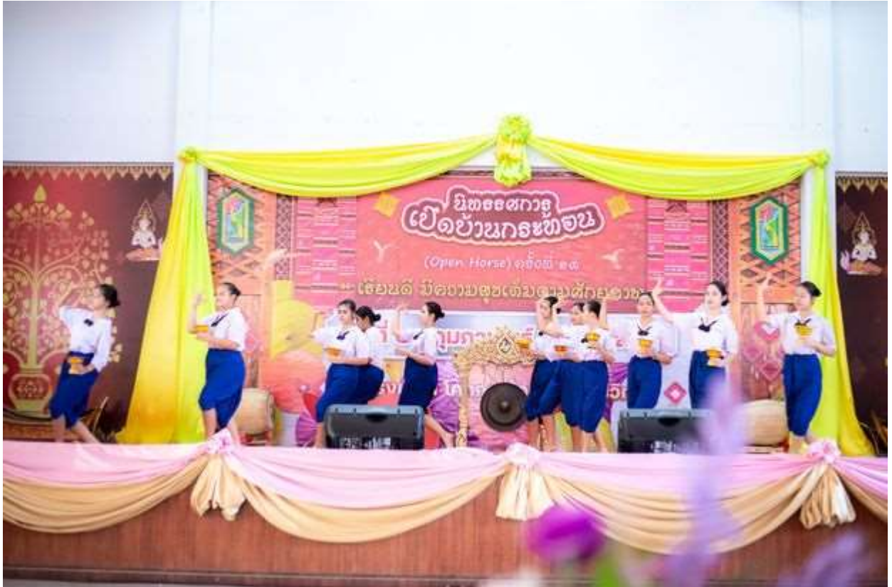
ภาพประกอบการเข้าร่วมประชุม/อบรม/สัมมนา/การรับรางวัล เรื่อง เข้าร่วมกิจกรรม นิทรรศการเปิดบ้านกระทอน ครั้งที่ 13 วันที่ 20 กุมภาพันธ์ พ.ศ. 2567