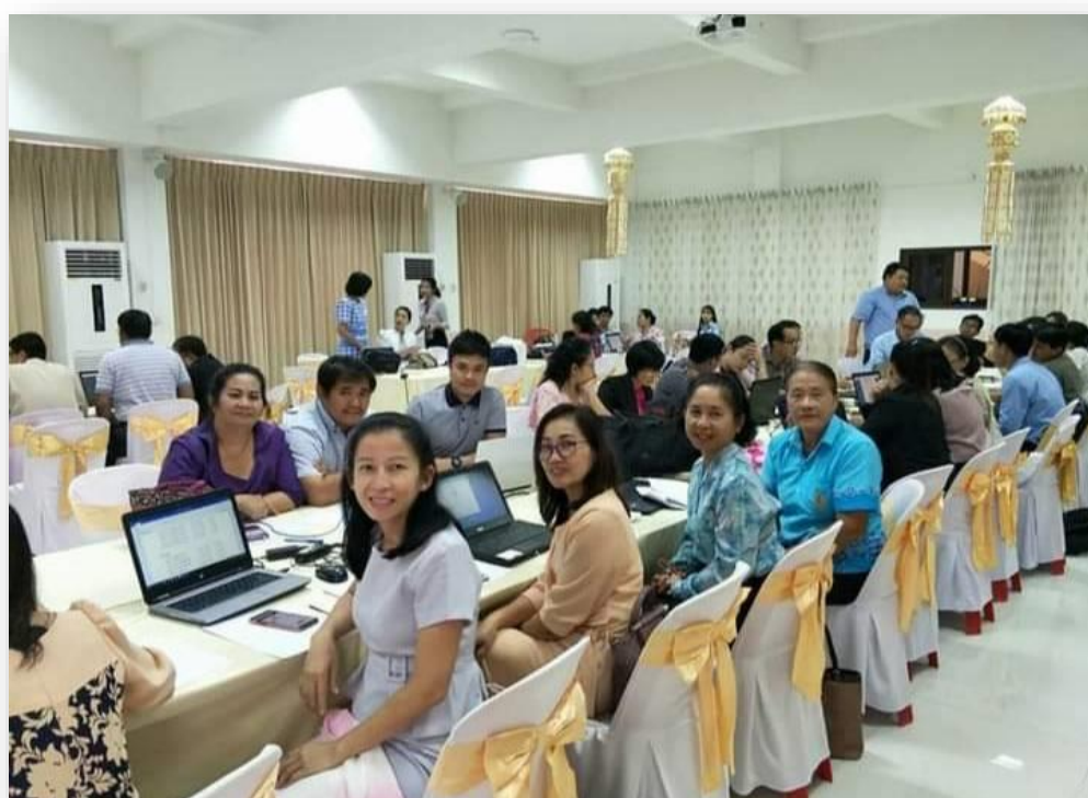
เข้าร่วมอบรม