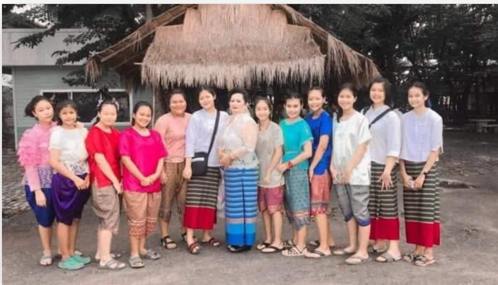
จัดกิจกรรม วันลอยกระทง