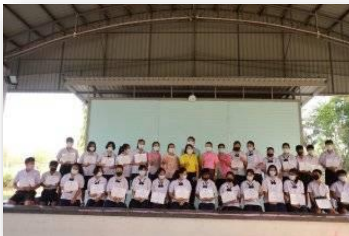
รางวัลที่ 1 ระดับ ม.ต้น กราบพระ 5 ครั้ง