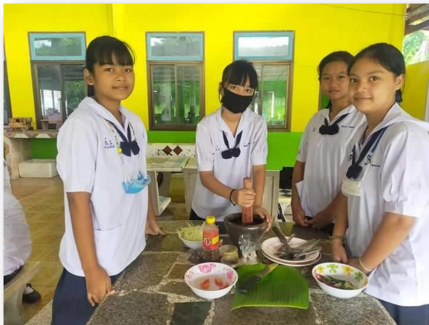
ปฏิบัติงานอาหาร วิชาการงานอาชีพ