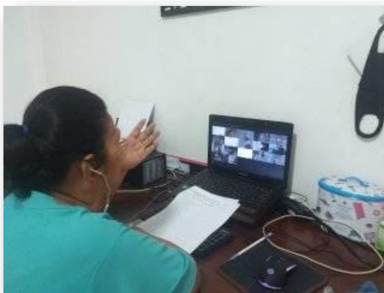
งานสอนออนไลน์ ช่วงสถานการณ์ โควิด