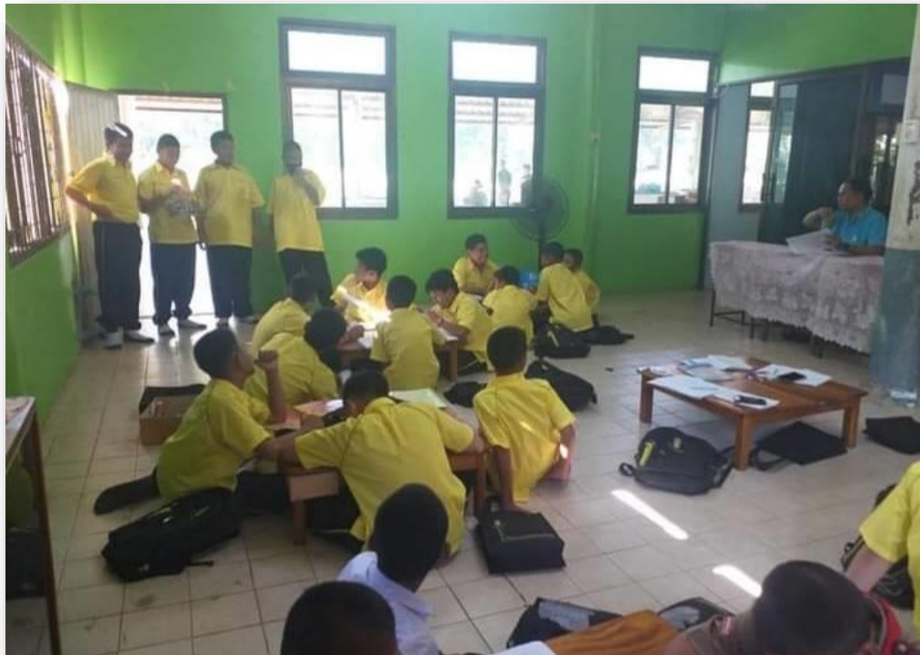
การจัดกิจกรรมการเรียนการสอนในชั้นเรียน