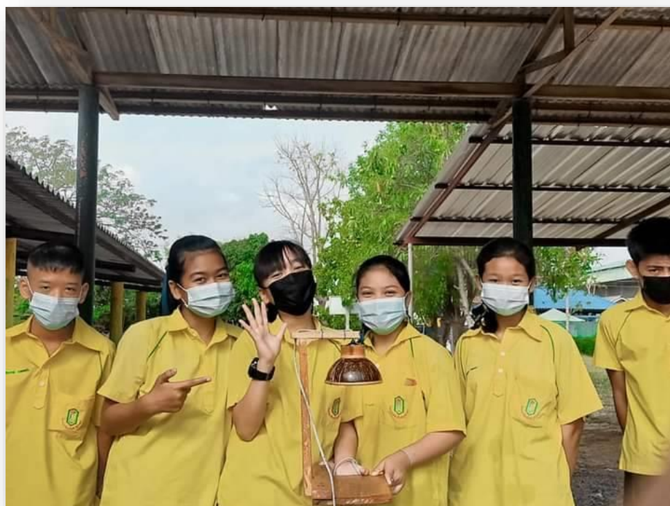
ปฏิบัติงานช่าง วิชาการงานอาชีพ