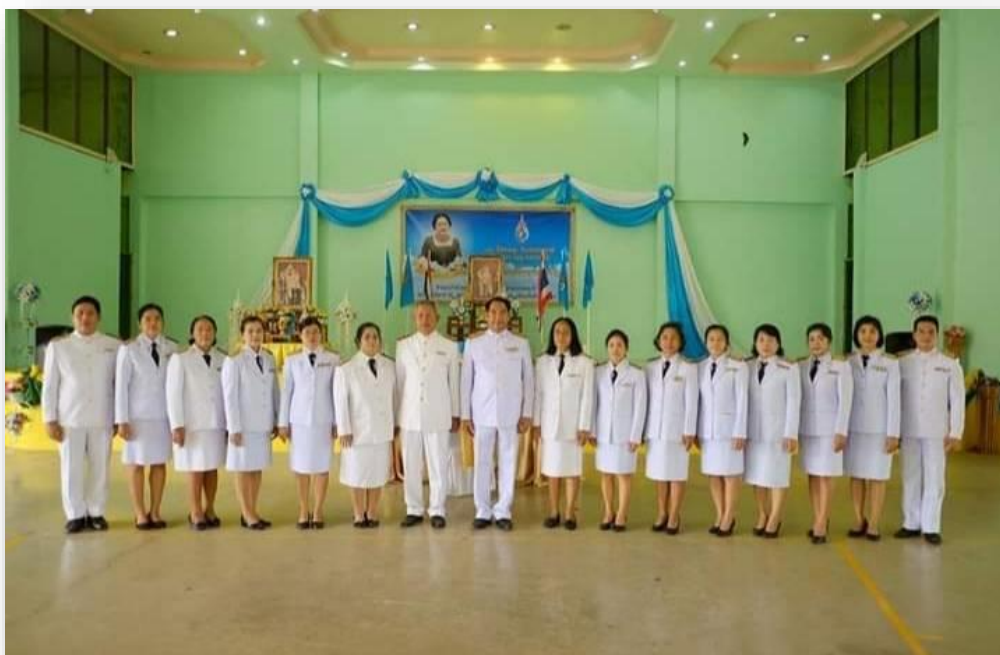
จัดกิจกรรม วันแม่